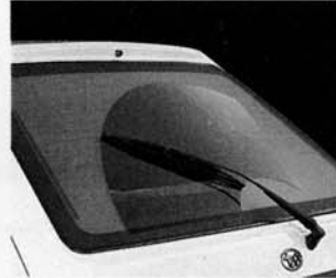
Heizbare Heckscheibe mit Wisch/Wasch-Anlage