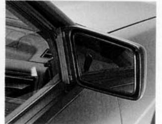
2 Außenspiegel - beim JUSTY 1200 von innen verstellbar